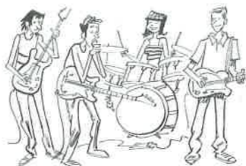
Tina toca la batería en un grupo de rock.

PERO: ir/venir/viajar en metro, autobús, tren... Me gusta viajar en tren, pero para viajes largos, prefiero ir en avión.