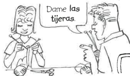
Dame las tijeras .

La lámpara azul es preciosa. (= esta y no otra) Estamos en la habitación 323.