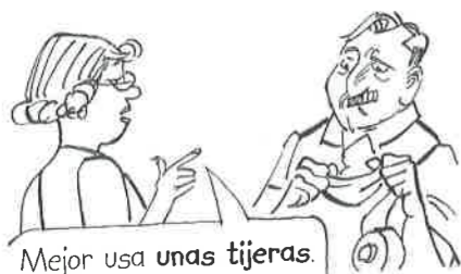
Mejor usa unas tijeras .

Necesito una lámpara . (= una lámpara cualquiera) Queremos una habitación .